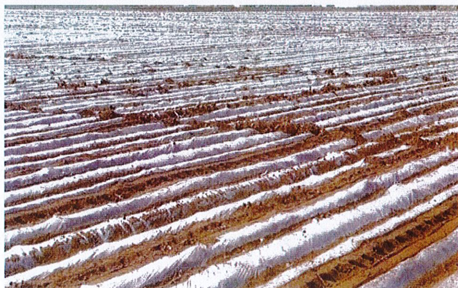
图 3 起垄覆膜示意图