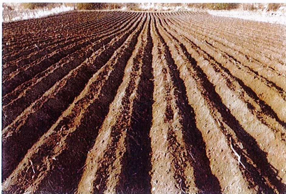
图 2 旱地起垄示意图

(2)有效土层厚度。恢复耕地后土地相对平整达到可耕种条件，土碎、上虚下实，并按耕作需要加盖覆膜。旱地有效土层厚度30cm 以上，水田、水浇地有效土层厚度40cm 以上。